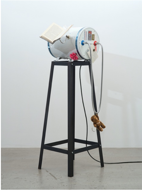
梁志和，《柏林》，電熱水爐、書籍、水晶、硬幣、明信片、毛絨玩具、鋼架，138.5 x 64 x 56 厘米

《柏林》是一個由多件歷史事件、時間線和地點建構而成的雕塑。中心部件是一個舊熱水爐，由 1967 年成立的本地廠商柏林牌所造，同年爆發香港六七暴動。當時最著名爆炸案在香港希爾頓酒店發生，而位於柏林的希爾頓酒店亦被視為 60 年代情報活動主要地點。柏林牌熱水爐被修整得滴答作響，以提醒時間不斷流逝。