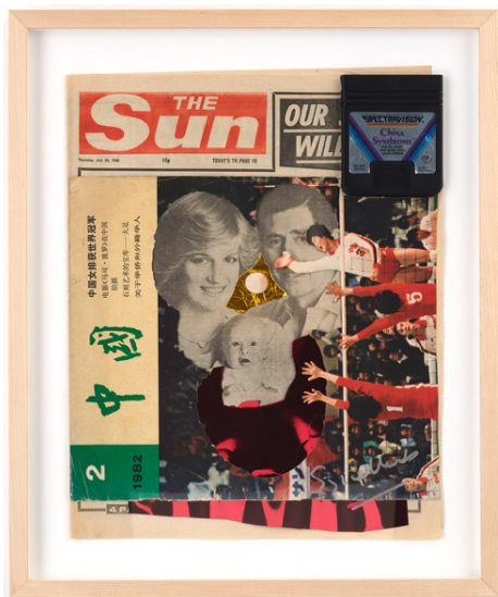
梁志和, 《卓越之陽》, 2023, 現成物、混合媒介拼貼, 46.8 x 39.8 x 4 厘米

《卓越之鏡》、《卓越之陽》、《卓越天天》和《卓越之星》是四件混合媒介拼貼作品, 用四份 1982 年 7 月 29 日同日刊登的不同報章創作而成。這些報章封面不約而同展示英國王室第一張家庭照以宣佈威廉王子誕生。作品框的亞加力膠片刻有戴卓爾夫人手書「非常好」, 來自 1982 年同日所寫某份公文, 作為中國大使和英方討論香港回歸的結論。而這事被隱藏在層層慶祝新聞之下。