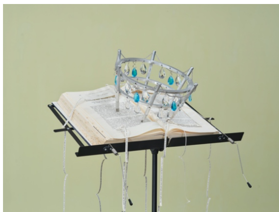
梁志和, 《收集淚珠》, 2023, 鋁合金架、玻璃、美工刀、書籍、譜架, 137 x 62 x 62 厘米

瀏覽著那些讀起來如同小說般的真實歷史事件, 梁氏調查歷史裡具爭議性的敘事。藝術家不只專注在史實, 在研究過程中利用獨特的「自我探索」方法, 提倡改變主體、轉換焦點等手法。截然不同的時間線被拼湊在一起, 挪用了戴卓爾夫人的手寫筆記 (取材自英國國家檔案館)、威廉王子誕生後第一張官方發放的照片、以及電視新聞檔案片段。結果是重新排列的一系列往事開啟了詮釋歷史的新可能, 成為對抗既定俗語「歷史是由勝利者書寫」的一劑良藥。