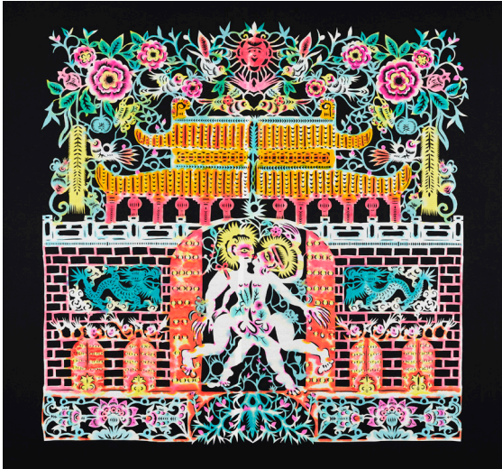
西亞蝶，《門》，2013，剪紙，水性染料和國畫顏料宣紙本，140 x 140 厘米。

在浪濤中行進的人們亦渴望被撫摸、被愛，這場感官之旅也充滿著酷兒式的喜悅與鹹濕的夢。性，是我們航行於慾望之海時強勁的馬達。