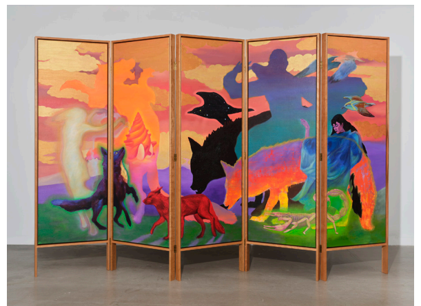
Zadie Xa 及 Benito Mayor Vallejo, 《Parade》, 2021, 油畫麻布及牛仔布本、手工櫻桃木框架, 200 x 325 x 6厘米。(圖片由藝術家及刺點畫廊提供。)

在藝術家的深描下，畫中形象正如裝載著變幻思想的容器，不斷遷移、顛覆著社會常態。例如，在東亞象征系統中代表奸詐與多變的狐狸在畫中成為人類農業社會中的危險人物，被西方社會所獵捕。同時，力量強大的女薩滿在中世紀因為使用巫術而被指控、詆毀、空開處刑。Xa的屏風畫如同劇場佈景，間隔出已知世界之外的鬼魅舞台，上演著薩滿狂喜、跨物種召靈與祖先的腹語。