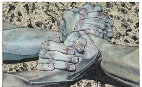
何麥克，《Common Feelings Met Halfway》，2022，油畫布本，25 x 40 x 2 厘米。

在這神秘的曖昧空間之上，何氏置入不同形象與物件，描述具體的感覺與動態，揭示跨文化關係與意義創造之中的脆弱性。《A Cowboy Renaissance》（2022）是一雙破舊的牛仔皮靴，它引伸出一個奇妙的故事：一位來自雲南的中國留學生在美國德州讀書，他完全融入了當地文化，操著一口美國南部口音，身著全套牛仔服飾。這個中國牛仔的怪異故事正正鏡照著西方理想對亞洲男子氣概的異化。《Drachenklauen》（2022）中，一隻雄壯龍爪演化為雞腳——正如在西方口味中，這道難以下嚥的中國美食始終無法被接受。《Common Feelings Met Halfway》（2022）中，一對男性氣質的手臂相互角力，難捨難分；《See You When I See You》（2022）則以無限的悲悽描繪一段不可逾越的距離。