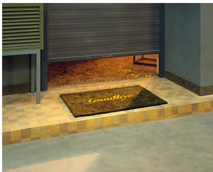
陳維，《Goodbye》，2019，收藏級噴墨打印、亞克力面裱裱，120 x 150 厘米

展覽以《Goodbye》(2019) 收尾，這幅攝影中，一扇半掩的大門前放著一張向拜訪者道別的門墊。正如陳維在一次藝術家訪談中所說，「我們都是在誤會和偏見中彼此生活。有差異才會有不同的文化，才会有他者的存在，才有那麼多無法抵達的、無法訴說的對象，才有永遠建不完的新城。」在《最後一夜》中，藝術家嘗試保留多重的立場、糾纏的物質記憶，以及關於創造新城的矛盾理想。