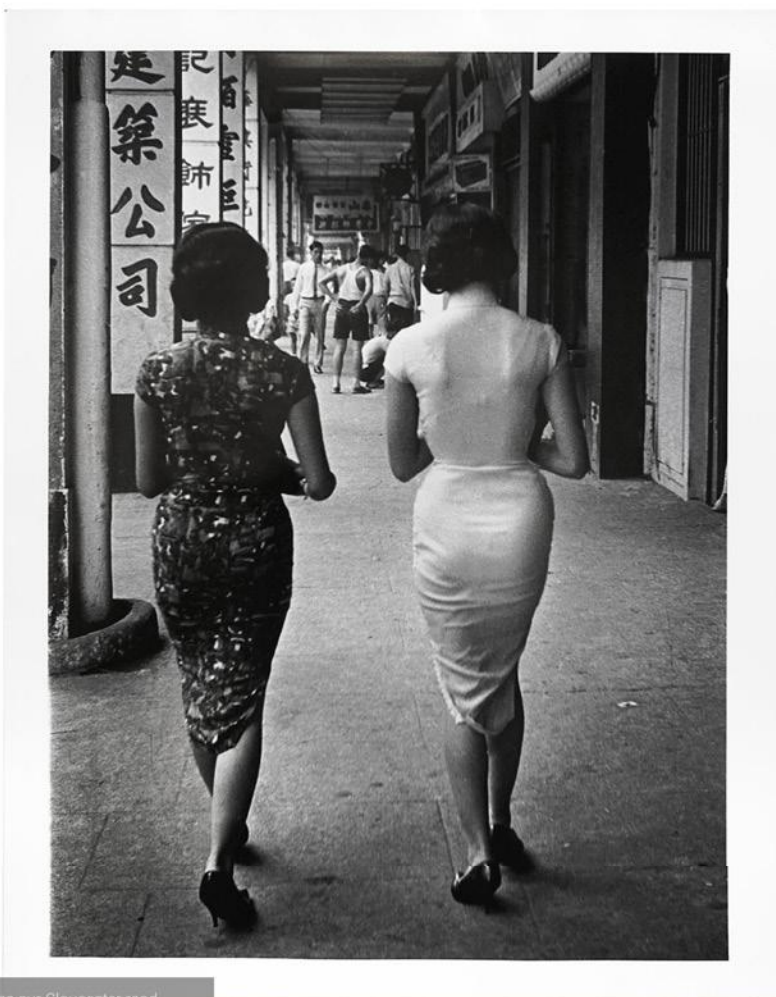
femmes sur Gloucester road, 1961

Yau Leung (1941-1997), photographe de grand talent malheureusement peu connu à l'extérieur de Hong Kong, a laissé des images saisissantes de la rue et du prolétariat hongkongais de la période d'après guerre.