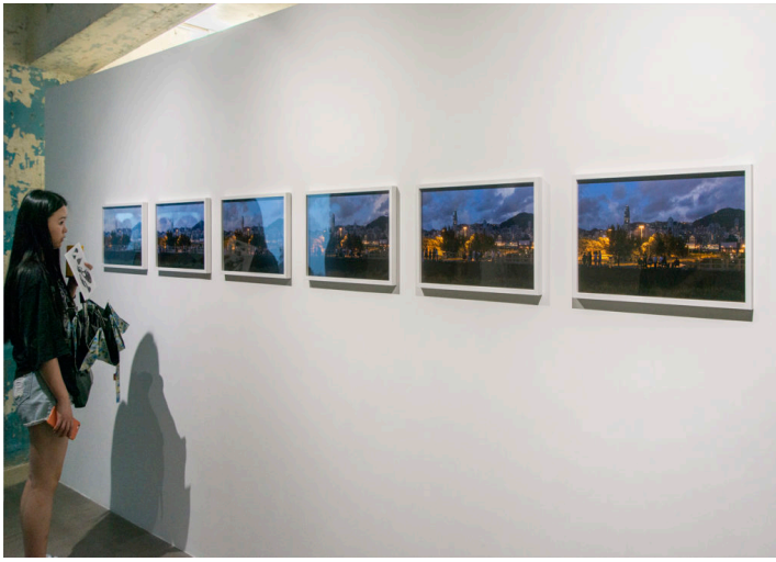
《仙境奇遇》的展期將於9月19日至11月11日。