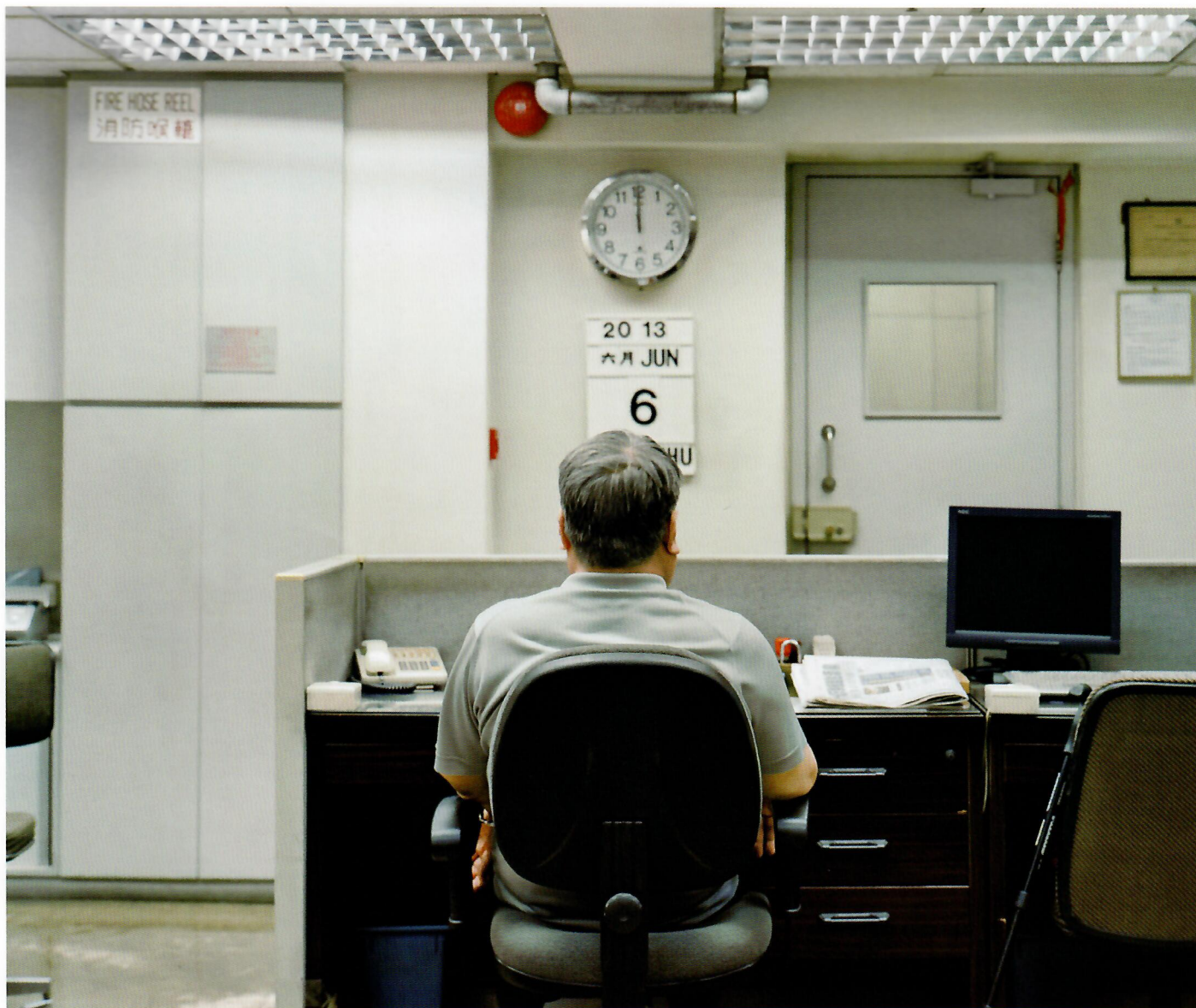
父亲于办公室，香港。“此”系列，2013