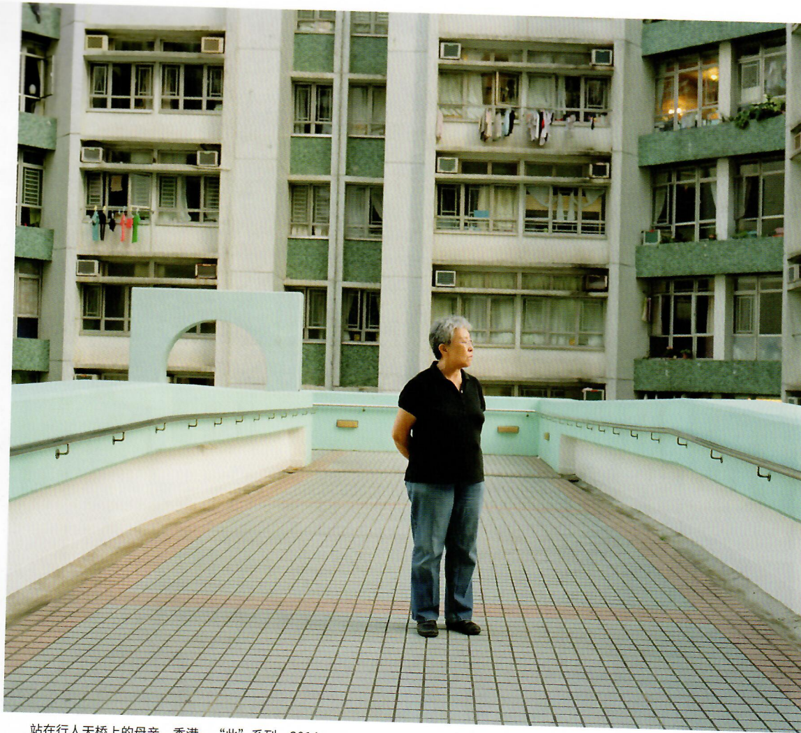
站在行人天桥上的母亲，香港。“此”系列，2014