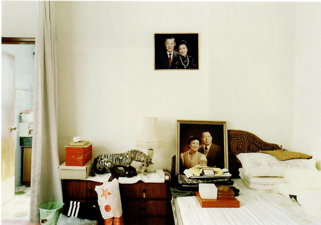
姥姥姥爷的卧室, 香港。“此”系列, 2000年