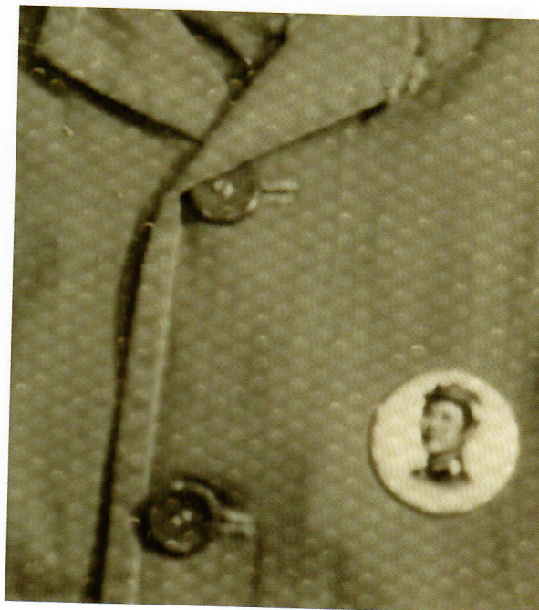
襟章，北京，1968年。“相册”系列，2014