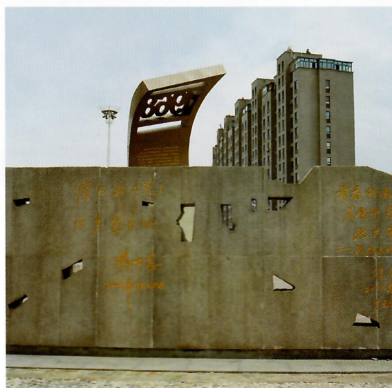
纪念碑，黑龙江佳木斯。“此”系列，2014