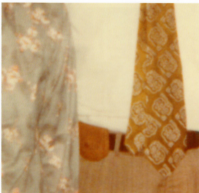
爷爷奶奶，香港，1979年。“相册”系列，2014