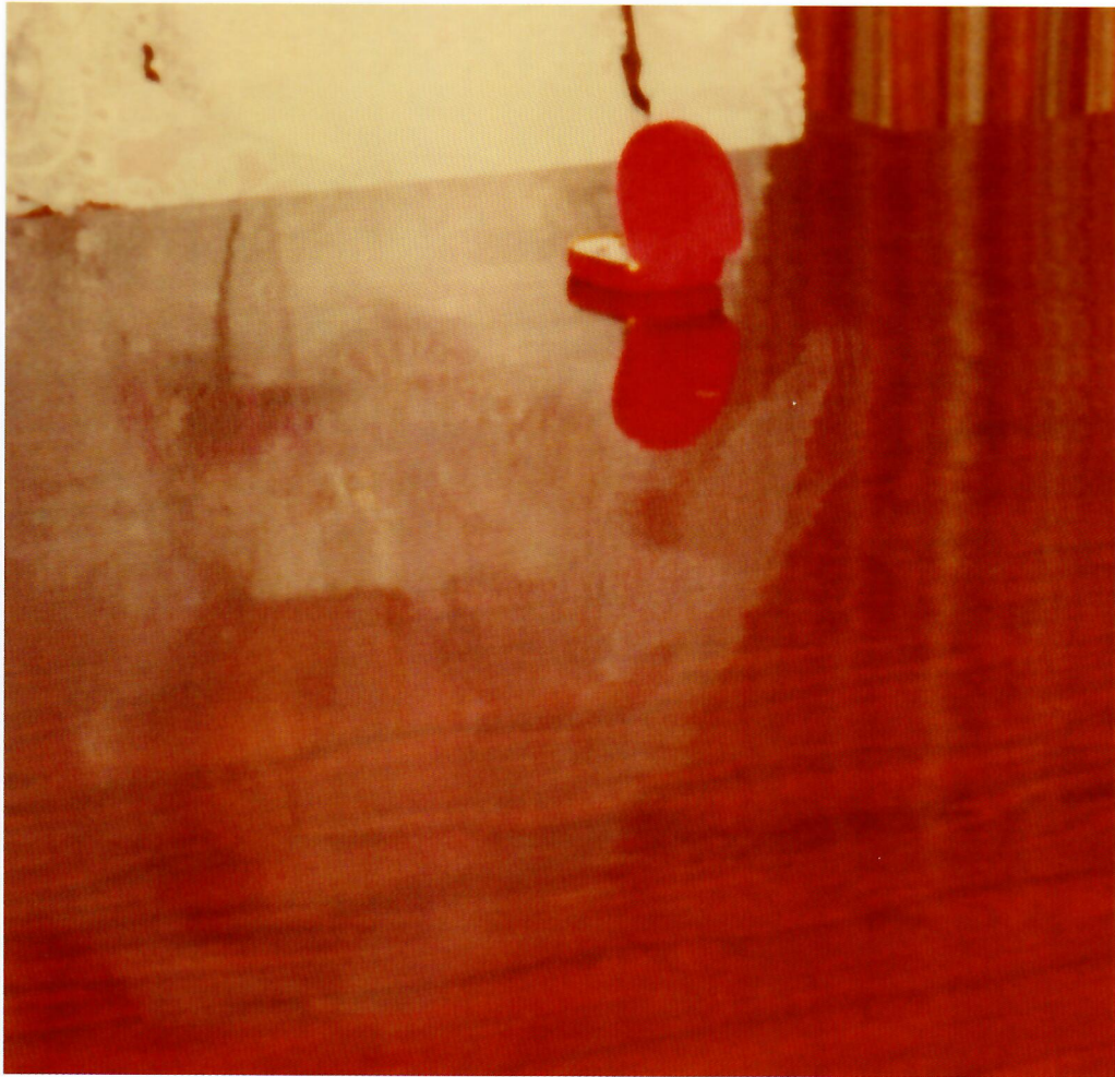
于婚姻注册处, 香港, 1981年。“相册”系列