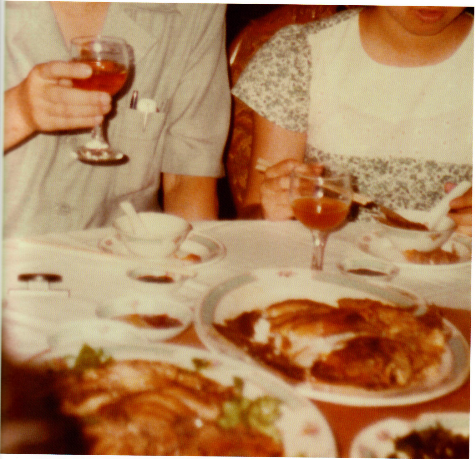
公司聚餐，香港，1979年。“相册”系列，2014