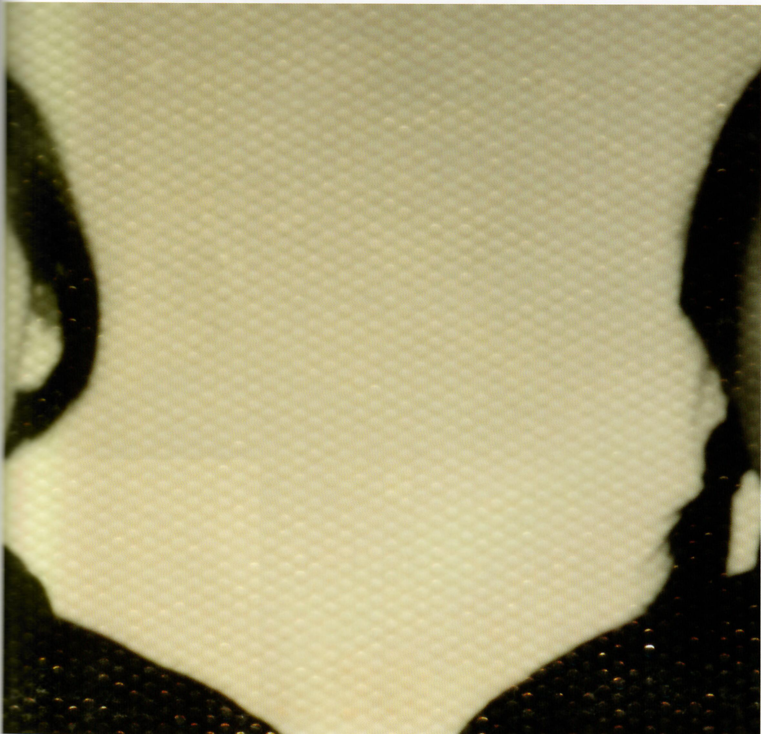
姐妹，北京，1968年。“相册”系列，2014