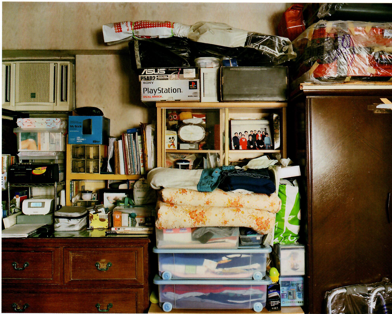
父母的睡房，香港。“此”系列，2012