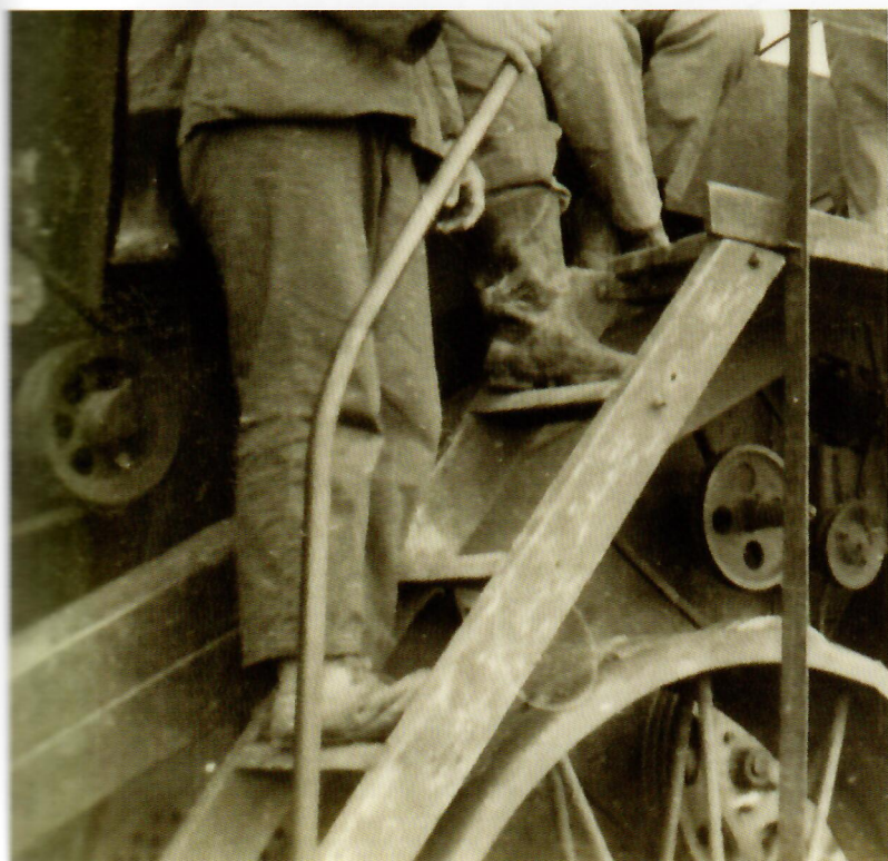
北大荒，合照，1971年。“相册”系列，2014