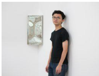
「為了有所懷念，人們得先失去某物。」香港藝術家鄺鎮禧使用的織薄中介