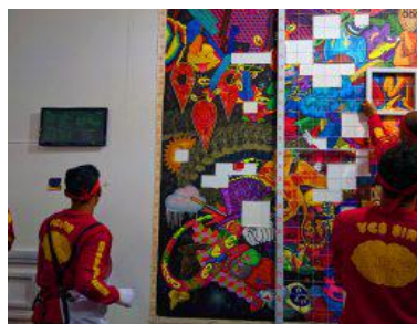
小巧、實驗、混雜：Art central的3個重點