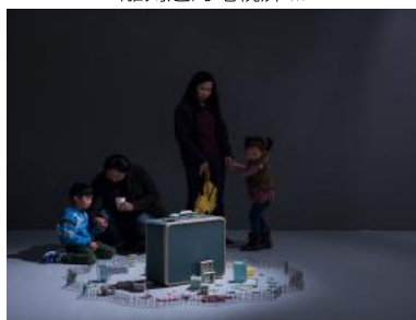
藝術家與母親之間的身份掙扎？女性藝術家探索創作與生活的關係