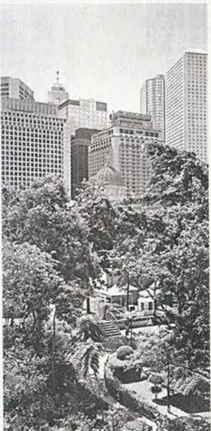
■ 吳世傑的《Found Landscape》