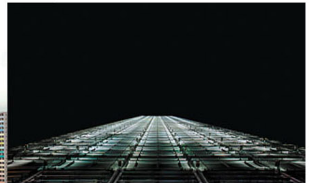
■換個角度看本土著名地標