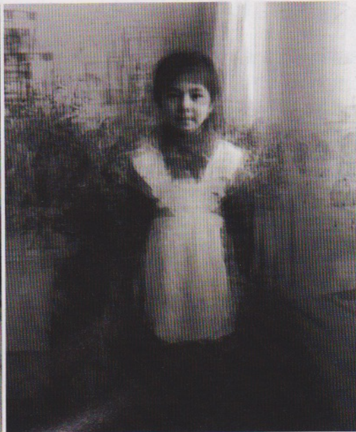
《我》系列雖是黑白照，卻沒有顯得冰冷而單調，畫中人的神態更予人祥和感。