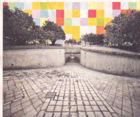
■《平日常陸拾伍》的隧道，曾出現於何氏以往的作品《光之道》。

在水天圍村屋生活的他，除了用鏡頭捕捉天水圍不斷變遷的面貌，更在拍攝與手繪彩色格子的過程中，作為對亡父的追憶。「爸爸過身時，年紀尚小未畢業，沒有太大感覺，反而現在對他的思念愈來愈濃。」拍攝時他幻想，若果父親仍在世，已經到