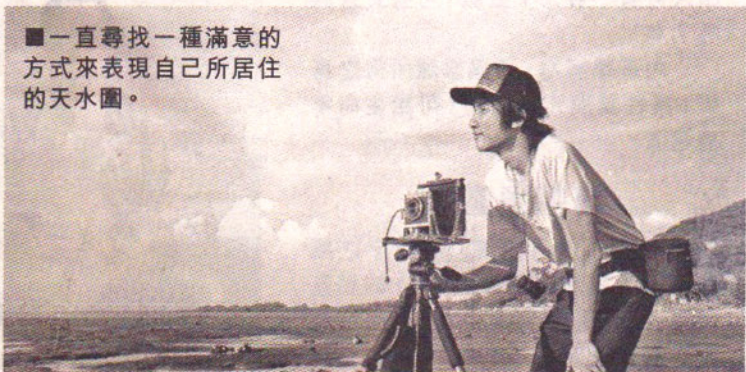
■一直尋找一種滿意的方式來表現自己所居住的天水圍。