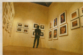
▲《光之道》作品獲日本清里攝影藝術館典藏，藏下了《光之道》的持續創作。

原本修讀社工系的他，沒有受過正式的攝影訓練，只是讀理大時於學生報兼任攝影。畢業後，他任職雜誌社編輯，以半途出家的攝影師身份，將《光