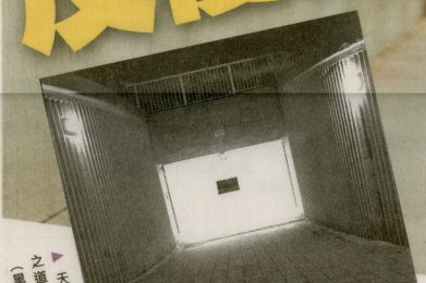
◀ 天水圍隧道是《光之道》系列的源頭。(黑白圖片)

隧道，打透點與點之間的地下橋樑，隱密而迂迴，予人不宜久留的印象。何兆南用光影演繹，壓縮的空間裏，極其光明卻滿布疑惑，是始也是終，反覆不定。