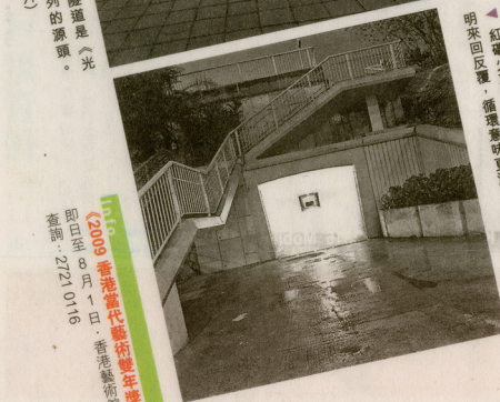
◀ 紅磡火車站的隧道由兩段隧道組成，黑暗、光明來回反覆，循環意味更濃。(黑白圖片)